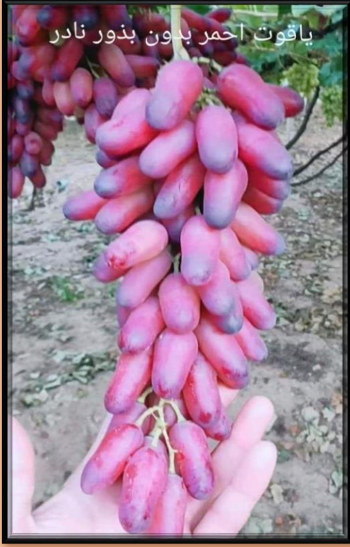
باقوت احمر بدون بذور نادر

في السابق كان يملك مزارع ليمون بحدود ألف شجرة ليمون، وبعدها أخذت القرار وكان قرار حاسم وصعب بالنسبة لي وجريء جدا، قمت بقطع كل شجرة ليمون موجودة لدي بالمزارع كلها، ودخلت بعدها إلى عالم الموسوعات العلمية فيما يخص كل أشجار العالم، وبالصدفة ظهرت أمامي الأشجار الاستوائية، وبناءاً عن تجربتي بزراعة شجرة السدر مع العلم أنها شجرة غير استوائية هي في بلاد الشام